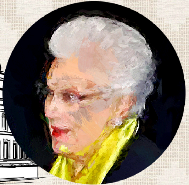
Dame Dora Dulceton

Nach einem großartigen Konzert der gefeierten Sängerin Dora Dulceton wird Mrs. Galiot von einer jungen, etwas desolaten Frau angesprochen. Sie äußert sich äußerst abfällig über die Sängerin Dulceton und behauptet selbst Sängerin zu sein. Mrs. Galiot stellt einen Auftritt bei einem Heilsarmeekonzert in Aussicht und gibt der jungen Frau ihre Visitkarte. Ein Drogendealer wird verhaftet. In der Wohnung wird auch die Visitkarte von Mrs. Galiot gefunden. Inspector Pillock ist irritiert.